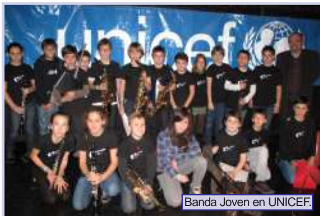
Banda Joven en UNICEF.

Bienvenidos a todos después de estos días de descanso y feliz aterrizaje a este nuevo año. Los profesores de Píccolo son comprensivos y saben que estos días no habéis dedicado mucho tiempo a estudiar música; pero el tiempo de relax ha terminado y queremos continuar con la misma intensidad de actividades que programamos durante el curso. En especial este 2014-15 en el que os recordamos que ¡seguimos de aniversario!