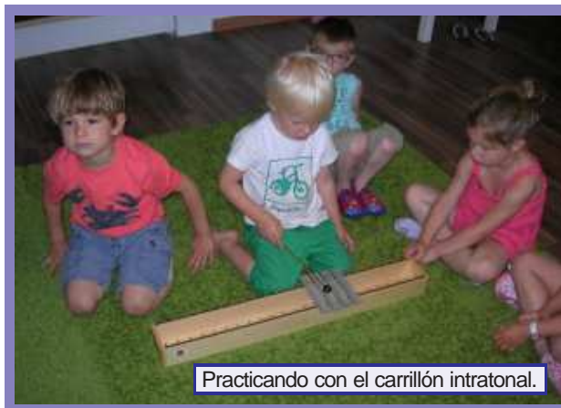
Practicando con el carrillón intratonal.

La actividad se realiza este segundo trimestre a través del juego y en un ambiente de silencio. El elemento de trabajo es un «carrillón intratonal» que contiene láminas idénticas a la vista con distancias de tono, semitono, cuarto de tono y dieciochoavo de tono. Estas láminas se desordenan y el alumno debe escucharlas e ir ordenándolas de grave a agudo. Este juego contribuye a entrenar el oído y supone un reto para ellos ya que cada uno debe afrontar este desafío de forma individual. Además también supone una satisfacción, ya que todos los participantes reciben un diploma en el que se premia su buen oído musical. Un diploma anecdótico que por otro lado sirve de estímulo y motivación para seguir trabajando esta capacidad musical.