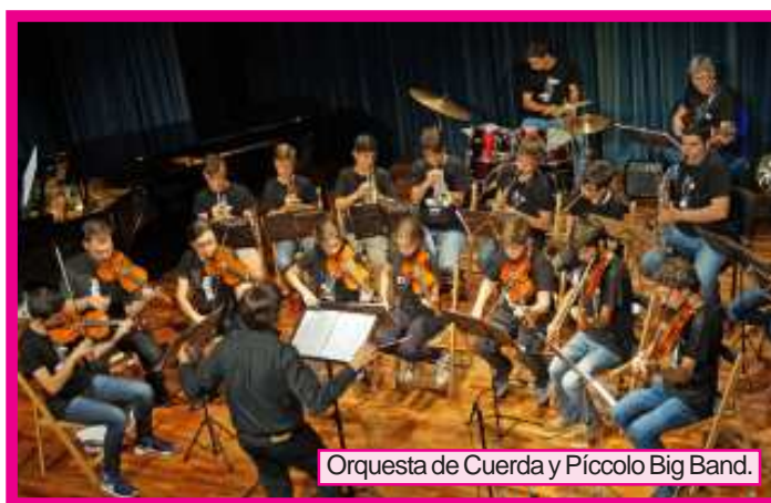
Orquesta de Cuerda y Pícolo Big Band.

Todas las actuaciones se pueden destacar pero hay que tener especialmente en cuenta el concierto que se realizó en el Auditorio del Ayuntamiento a beneficio de UNICEF. Con el slogan «Gotas para Níger» diversas agrupaciones de la Escuela acompañadas por colaboradores y solistas, ofrecieron un concierto en el que hubo una ocupación de la sala más que aceptable.