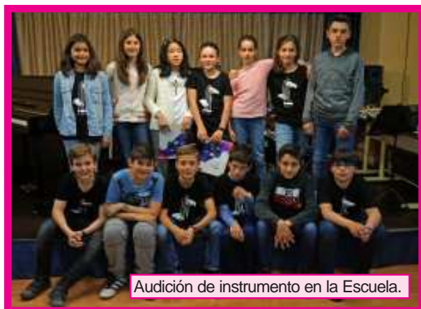
Audición de instrumento en la Escuela.

Desde estas líneas queremos agradecer a los participantes y a sus familias el esfuerzo e implicación en todas las propuestas de la programación de Mayo Musical. Los conciertos y audiciones están pensados para que disfrute el público; pero sin vuestra colaboración esto sería imposible. El próximo curso habrá más. ¡Enhorabuena y gracias!