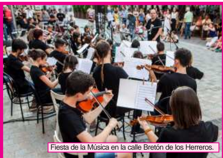
Fiesta de la Música en la calle Bretón de los Herreros.

Y unos días más tarde, el viernes 23 de junio, celebramos la fiesta de Fin de Curso en la que aprovechamos para despedirnos de profesores y compañeros de clase hasta el próximo curso. En esta ocasión el calor nos dio una tregua y la Plaza Escocia se convirtió un año más en un gran auditorio al aire libre, acogiendo a diversas formaciones musicales con niños, jóvenes y adultos. Una tarde inolvidable en la que algunos nos reencontramos con antiguos compañeros, que se acercaron por la plaza y que además se animaron a tocar con nosotros. ¡¡¡Estuvo genial!!!