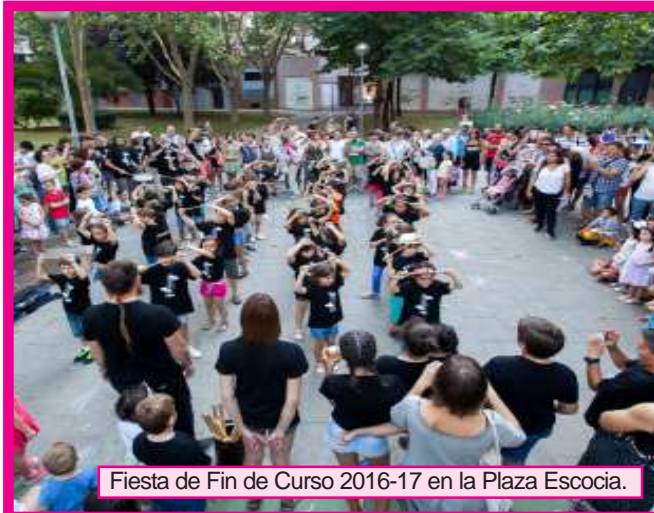
Fiesta de Fin de Curso 2016-17 en la Plaza Escocia.