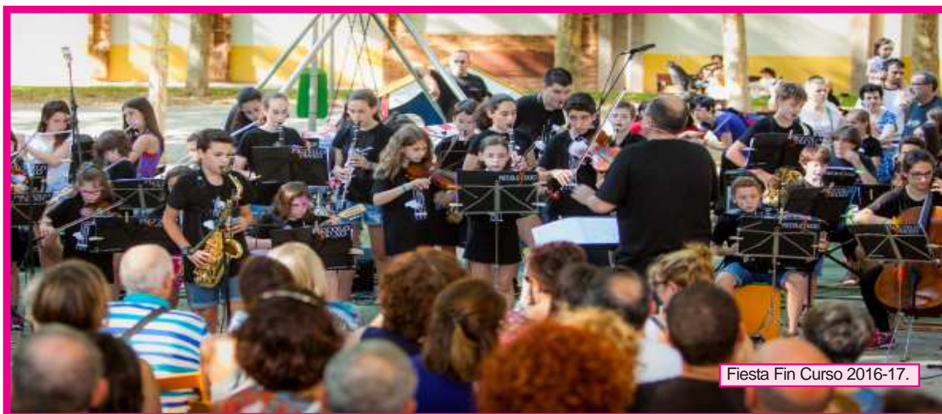
Fiesta Fin Curso 2016-17.

Así que, como os indicamos al principio, bienvenidos a este nuevo curso y estad atentos al tablón de la Escuela y a vuestro correo porque estamos inmersos en proyectos, audiciones, conciertos... actividades dirigidas a todos los que disfrutamos con la música.