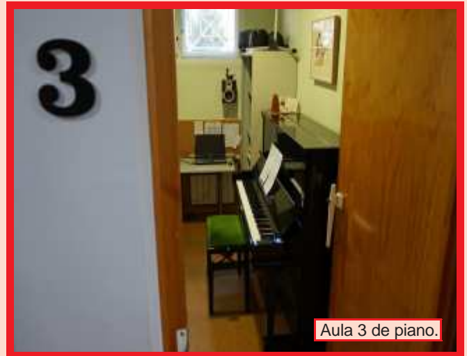
Aula 3 de piano.