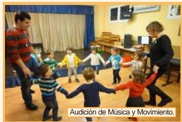
Audición de Música y Movimiento.

Y como colofón a este final de año, ¡la Chocolatada! un clásico ya en las actividades que programa la Escuela todos los cursos. En