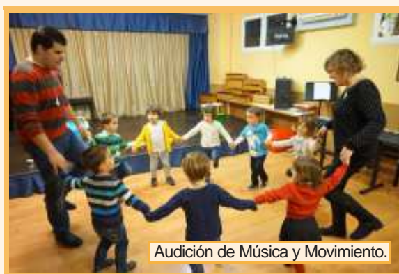
Audición de Música y Movimiento.

Y como colofón a este final de año, ¡la Chocolatada! un clásico ya en las actividades que programa la Escuela todos los cursos. En