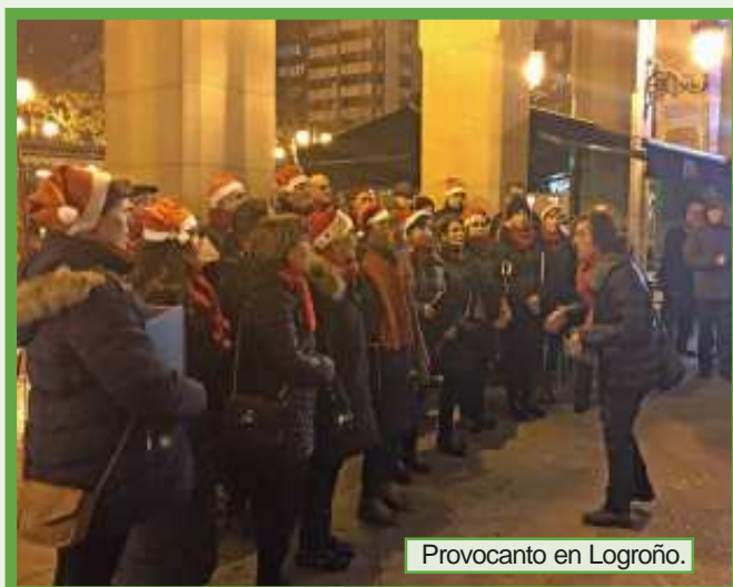
Provocanto en Logroño.

Y para este año 2018 tiene confirmadas, de momento ya dos fechas. La primera, el 17 de marzo en Vitoria-Gasteiz donde celebrarán un Intercambio con la coral Canta Cantorum. Unos meses más tarde, el 2 de junio, se desplazarán a Sariego (Asturias) para participar en el encuentro coral «La sidra y el mar», y el siguiente sábado 16 de junio la coral de Sariego ofrecerá un concierto en Logroño devolviendo así la visita a Provocanto.