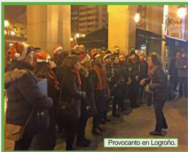
Provocanto en Logroño.

Y para este año 2018 tiene confirmadas, de momento ya dos fechas. La primera, el 17 de marzo en Vitoria-Gasteiz donde celebrarán un Intercambio con la coral Canta Cantorum. Unos meses más tarde, el 2 de junio, se desplazarán a Sariego (Asturias) para participar en el encuentro coral «La sidra y el mar», y el siguiente sábado 16 de junio la coral de Sariego ofrecerá un concierto en Logroño devolviendo así la visita a Provocanto.