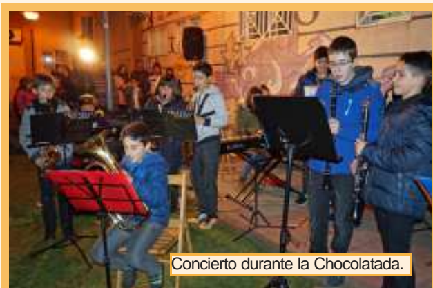
Concierto durante la Chocolatada.

esta ocasión participaron la Banda Joven y la Colectiva de Viento ofreciendo su concierto en la Plaza Escocia, mientras el público disfrutaba de un chocolate con bizcochos.