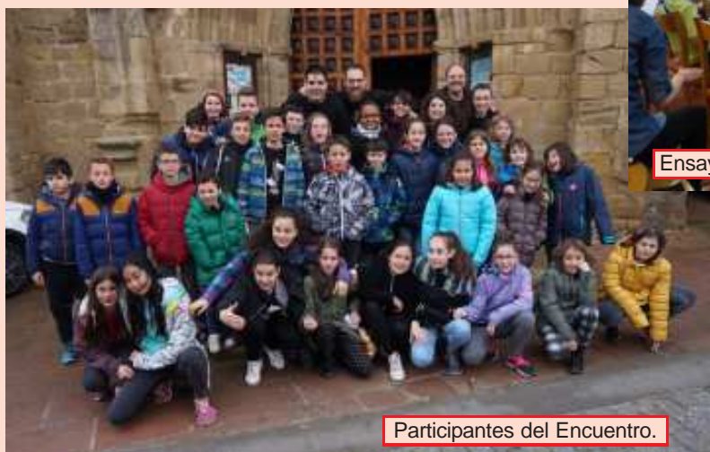
Participantes del Encuentro.