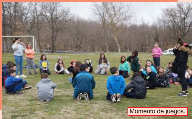
Momento de juegos.