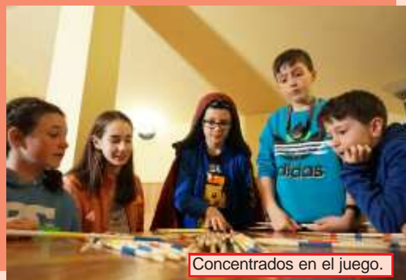
Concentrados en el juego.

Los profesores y monitores terminaron tan contentos que dicen que en 2019 van a organizar un campamento de verano. ¡Estad atentos!