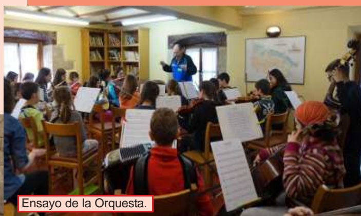
Ensayo de la Orquesta.