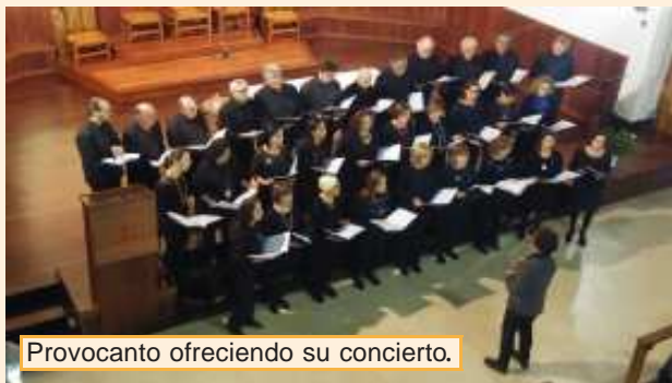
Provocanto ofreciendo su concierto.

El pasado sábado 17 de marzo, Provocanto viajó hasta Vitoria-Gasteiz para participar en un concierto celebrado en la Iglesia de San Cristóbal. En esta ocasión Provocanto devolvía la visita a la coral Canta Cantorum que ya estuvo en Logroño en abril de 2016. Ambas agrupaciones interpretaron diversos temas corales completando un programa muy variado con; habaneras, espirituales, temas de películas,...y finalizaron interpretando conjuntamente la conocida canción Nerea izango zen , popularizada por el cantautor vasco Mikel Laboa.