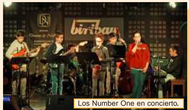
Los Number One en concierto.

además de disfrutar de sugerentes improvisaciones y de un amplio repertorio de estilos que abarcaron desde el jazz, pop, rock o bossa-nova. ¡Enhorabuena a los participantes!