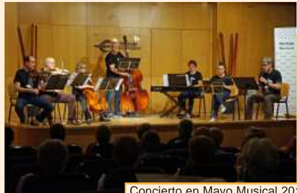
Concierto en Mayo Musical 2017.

Cada concierto que se propone es de un interés concreto; las audiciones individuales en Píccolo dan la oportunidad a algunos de estrenarse en el escenario y mostrar a todos en general, su trabajo durante el curso. Sin embargo y sin desmerecer ninguna de las propuestas programadas, hay que destacar el concierto del viernes 4 de mayo en el Auditorio del ayuntamiento de Logroño a beneficio de UNICEF, en el que participan las bandas de viento de la Escuela, desde la más noble hasta los veteranos de la Píccolo Big Band. Otras recomendaciones son el concierto en el Museo Würth La Rioja el domingo 13 de mayo a cargo de las Orquestas o los Coros en el Centro Fundación Caja Rioja-Bankia Gran Vía el viernes 18.