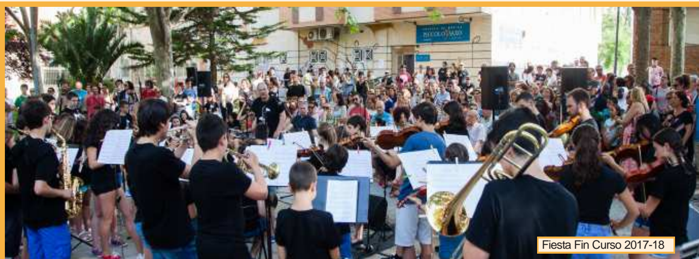
Fiesta Fin Curso 2017-18

Finalmente os prometemos que este va a ser un curso singular, con novedades y sorpresas así que prestad atención al tablón de la Escuela, a la web y a vuestro correo electrónico porque os van a llegar numerosas propuestas musicales en forma de conciertos, audiciones o actividades.