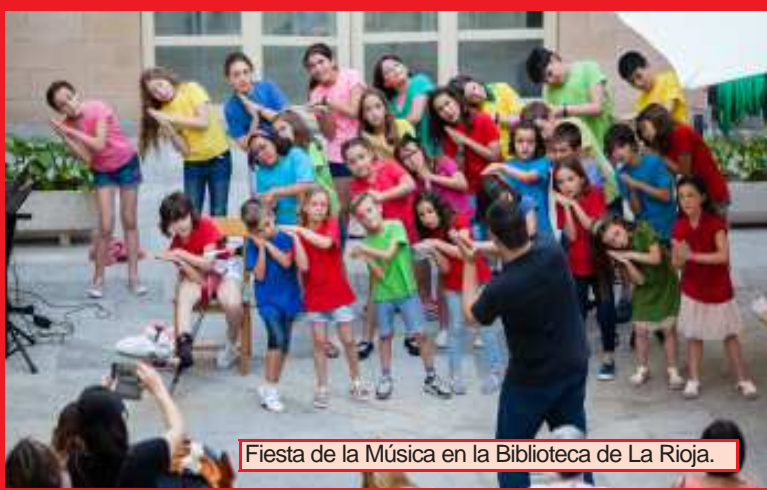
Fiesta de la Música en la Biblioteca de La Rioja.

Y pocos días después, la tarde del 26 de junio celebramos la Fiesta de Fin de Curso en la que convertimos la Plaza Escocia en un gran auditorio con música en directo hasta casi la hora de cenar. Este día es siempre especial y muy emotivo ya que sirve de despedida hasta el siguiente curso.