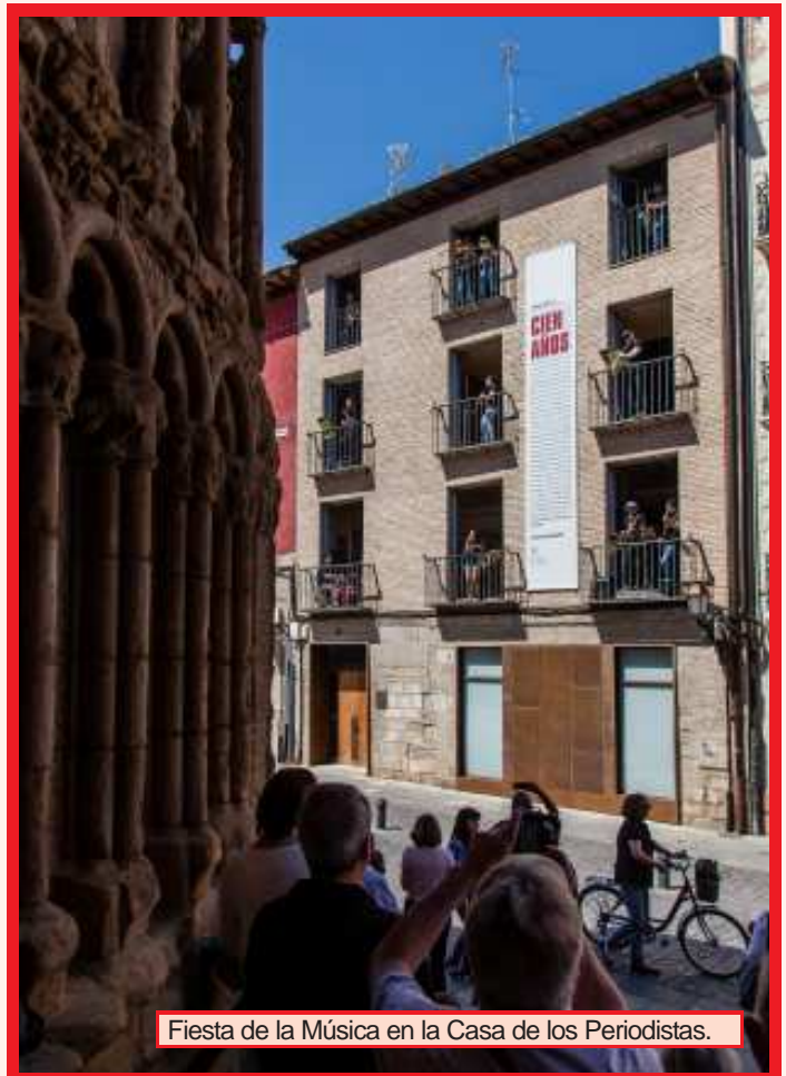
Fiesta de la Música en la Casa de los Periodistas.