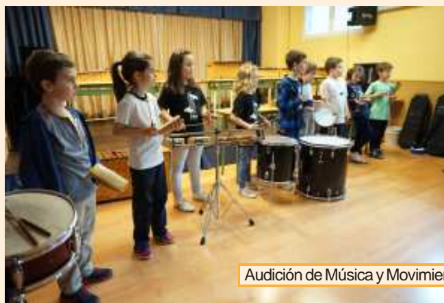
Audición de Música y Movimiento.

Como remate a este final de año, os invitamos a la Chocolatada, que tendrá lugar en la Plaza Escocia el viernes 21 de diciembre a partir de las 19:00 horas. Y si aún te quedan ganas, puedes cantar unos villancicos junto a Bandaluse y Provocanto el sábado 22 de diciembre a partir de las 20:00