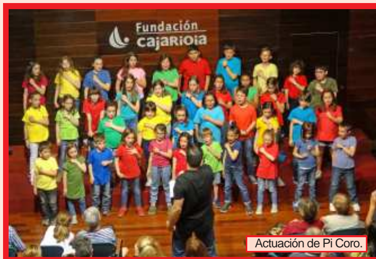
Actuación de Pi Coro.

Poder formar parte de un coro, es una oportunidad tan (o más) gratificante como cualquier otra afición que tengas, donde expresas y compartes con los demás, haciendo así que cada uno de los componentes sumen hasta