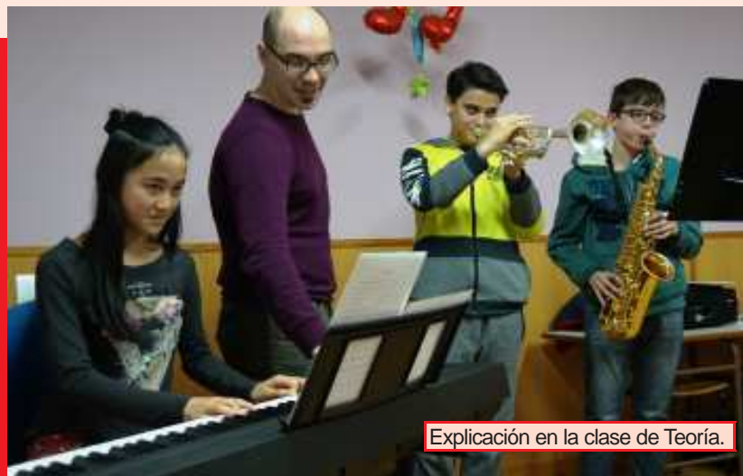
Explicación en la clase de Teoría.