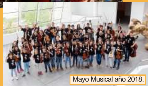
Mayo Musical año 2018.

La esencia de MAYO MUSICAL ha continuado en este tiempo y hoy nos encontramos en la celebración de la XV edición de la Semana Cultural Píccolo y Saxo y el V MAYO MUSICAL, con diferentes propuestas para todos los gustos. De la programación queremos destacar el concierto Gotas para Níger, una sesión a beneficio de UNICEF el viernes 10 de mayo a cargo de la Banda Joven, Píccolo Big Band y Pi Coro. Y otra propuesta son los dos conciertos que nos ofrecen el Coro y las bandas de la Escuela L'Antártida de Barcelona el sábado 18 de mayo en sesión de mañana y tarde. Con estos dos conciertos se da por cerrado el Intercambio Musical que hemos celebrado este curso con nuestros amigos de Barcelona.