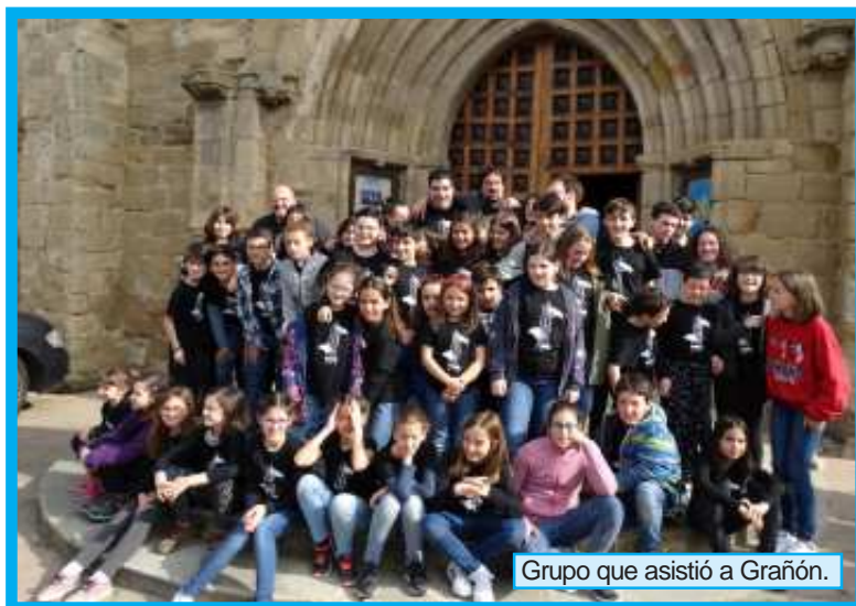
Grupo que asistió a Grañón.

El sábado hace un día estupendo, continuamos con los ensayos, esta vez por secciones en las que descubrimos las obras que tocaremos cada agrupación por separado. Después, en el tiempo libre vamos al bosque a buscar la botella que dejamos enterrada el año anterior y... ¡Allí está! Con la carta firmada por las chicas que este año, como ya son mayores, no han podido venir.