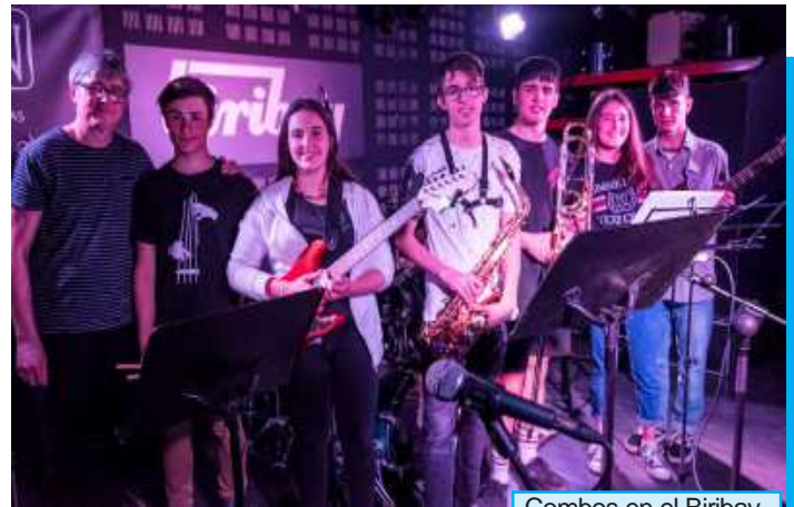
Combos en el Biribay

Pero como se indica al principio, las historias vienen y van, y así llegamos a los últimos días del curso con dos fechas clave. Por un lado, el viernes 21 de junio, que celebramos la Fiesta de la Música con diversos conciertos en varios puntos de la ciudad. De esta jornada, queremos destacar el concierto que tendrá lugar a las 20:00 horas en la Plaza de San Bartolomé. Más de 100 músicos estrenarán la obra Píccolo Plata,