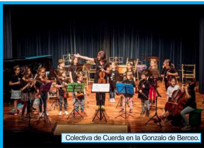
Colectiva de Cuerda en la Gonzalo de Berceo.

Aquí ponemos punto y final al curso 2018-19, confiamos en que hayáis disfrutado durante este tiempo tanto como nosotros y ahora, a disfrutar de unas merecidas vacaciones, no os olvidéis de tocar un poco durante el verano y nos vemos en septiembre.