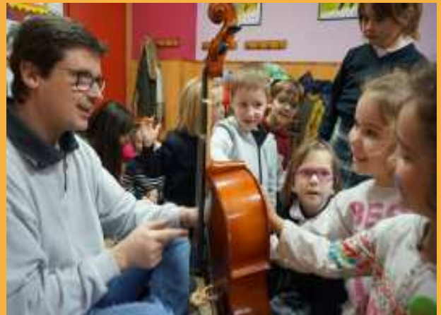
Alumnado de 5 años viendo el cello.

Por este motivo y desde hace tiempo, se puso en marcha el Taller de Septiembre, una actividad que tiene por objetivo orientar a los alumnos y alumnas y así escoger su instrumento. Además, desde hace tres cursos, la Escuela también ha puesto en marcha unos Talleres que se suelen celebrar entre los meses de abril y mayo y que van dirigidos a alumnado de 5 a 7 años que aún no asiste a clase de instrumento. A estos Talleres se asiste por indicación del profesor o profesoras de Música y Movimiento y el objetivo es dar la oportunidad de asistir a una clase de instrumento y conocer las características de los mismos.