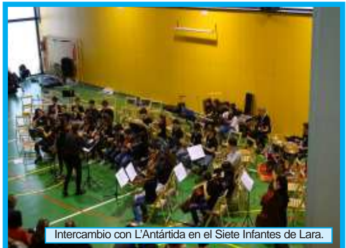
Intercambio con L'Antártida en el Siete Infantes de Lara.